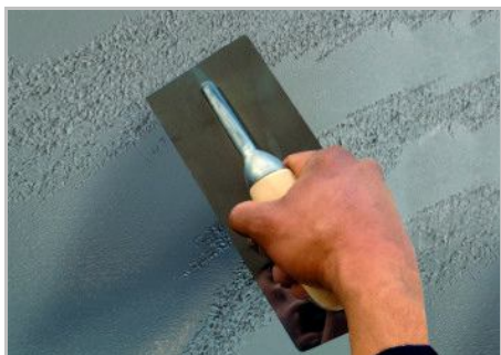
Schritt 5 - Wenn das Produkt zu trocknen beginnt, anfangen, zu verdichten.