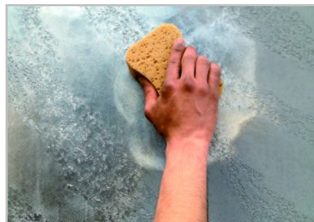
Schritt 6 - Das gewünschte Finish mit Gioia, Oro, White Paint oder Cera del Vecchio verwirklichen. Falls gewünscht, die Wand mit Vetro-Frammenti schützen.