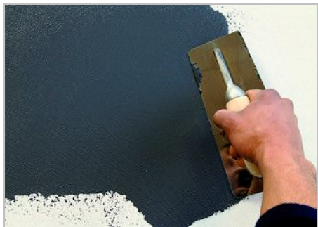
Schritt 3 - Erster Anstrich, das Produkt frei mit der Schwammkelle verteilen.