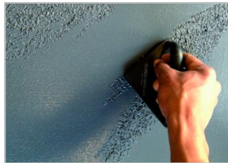
Schritt 4 - Mit dem spezifischen Zubehör den gewünschten Effekt verwirklichen.