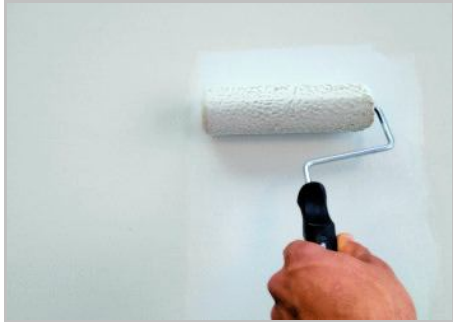
Schritt 1 - Zuerst Primus Naturale auftragen.

Muss vor der Anwendung nicht verdünnt werden. Behandelbar nach 12-14 Stunden. Vollkommene Trocknung der Wand nach 28 Tagen. Kühl und vor Feuchtigkeit und Frost geschützt lagern.